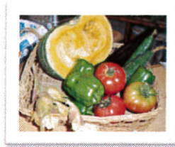
今回のテーマはこちらのお野菜です